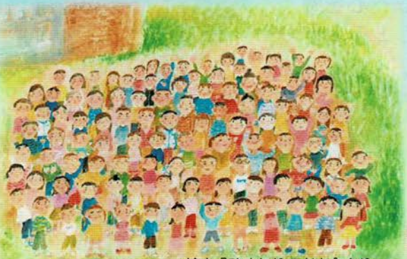
絵本『ひまわりのおか』より